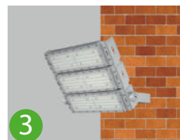
3 Fixation sur mur