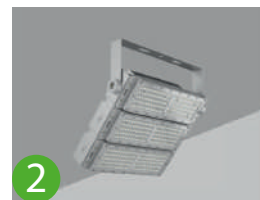
2 Fixation au plafond