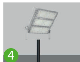
4 Fixation sur Pôles