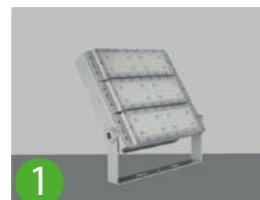
1 Fixation au sol